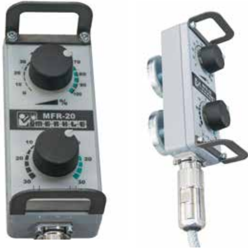
Fernregler inklusive Schutzbügel, zwei Magneten und Kabel mit Stecker und Dose

Remote control, incl. protection, 2 magnets and cable with plug and socket