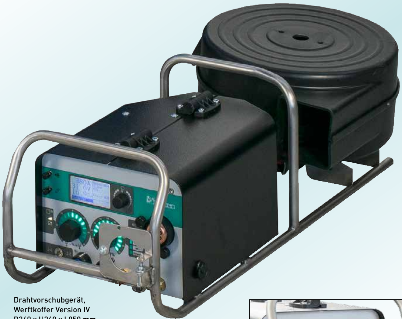
Drahtvorschubgerät, Werftkoffer Version IV B360 x H260 x L850 mm