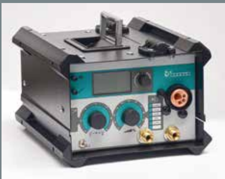
Zwischenantrieb DV-26 PP für zusätzlichen Aktionsradius

NFC user card for operation of the machine and NFC supervisor card for additional settings