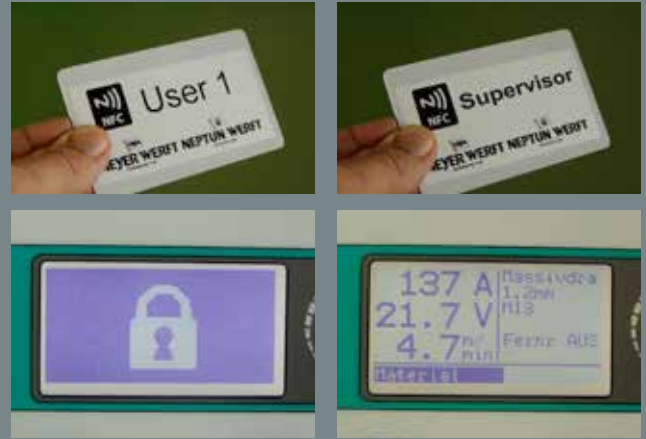
NFC User Karte zum Freischalten der Anlage und NFC Supervisor Karte für erweiterte Einstellungen

Remote control, incl. protection, 2 magnets and cable with plug and socket