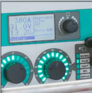
Einfache Bedienung und Multifunktions-Display