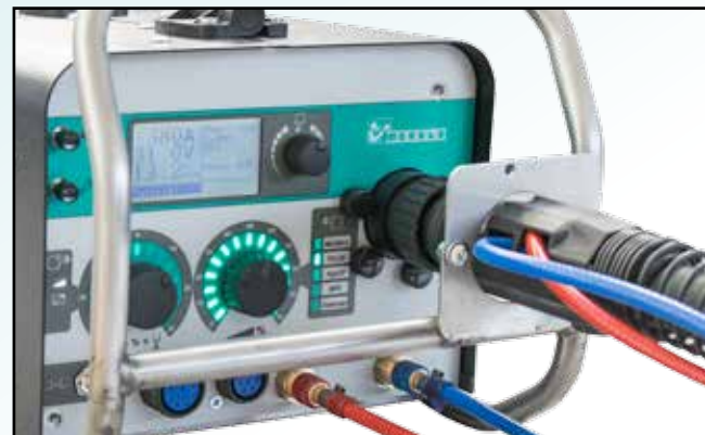
Well protected operation panel with kinking protection for torch connector