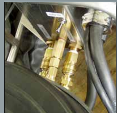
Schnellverbindung für Gas und Wasser