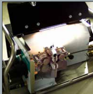
Drahtvorschub mit Beleuchtung am Getriebe